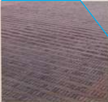
patroon op plein van diverse klinkers