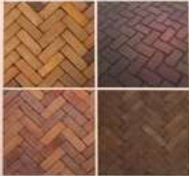
klinkers: dikformaat genuanceerd parkeren hergebruik dikformaat

Eigentijds vlak straatbeeld met mooie materialen